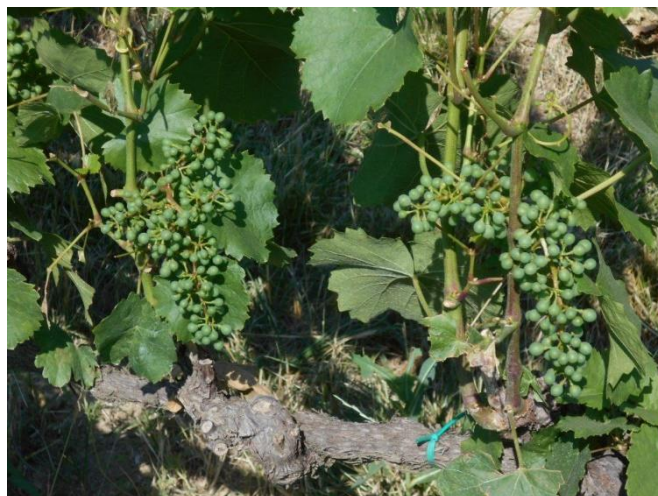
A lisztharmatos fürtöket érdemes kibontani, szellőssé tenni a tőkét