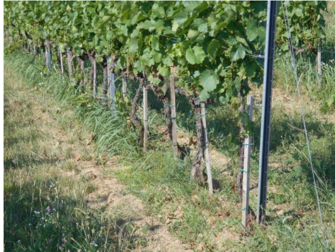
A gyomok erősen fejlődtek