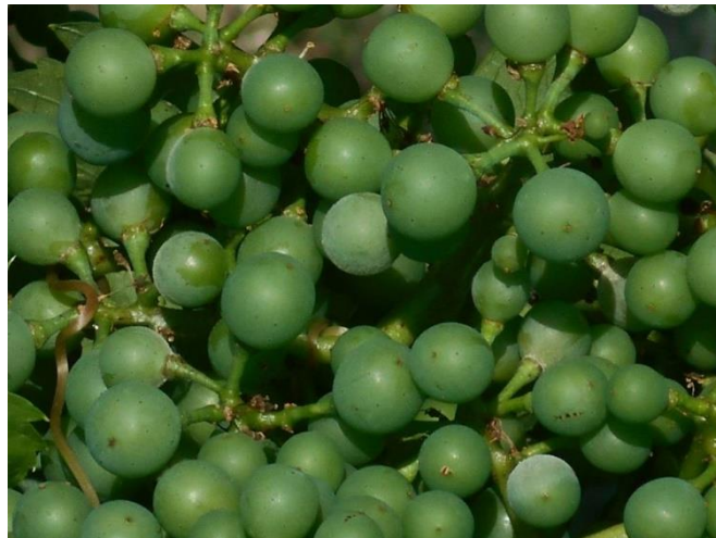
A lisztharmat gyorsan felszaporodott