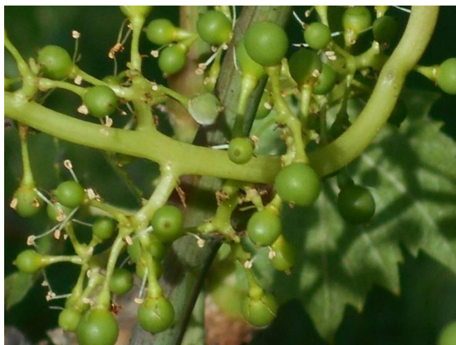
Friss lisztharmat bogyón