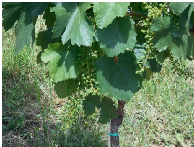
A fűtők száma nagy

Pénteken fokozatosan csökken a felhőzet, a déli órákra kisüt a nap. Sokfelé fúj erős ÉNY-i szél. Hétfővégre szikrázó napsütés, gyenge, mérsékelt D-i szél fúj. Strandidő, erős UV-sugárzás, fokozódó kánikula a legvalószínűbb. Hétfőn napközben is még napsütés és igazi kánikulai meleg lesz jellemző. Egy közeledő hidegfront hatására fokozódik a fülledtség. Délután már előfordulhat elszórtan zivatar, majd este, éjjel a heves zivatarok kelet felé terjeszkednek. Keddre virradóan a fronttal érkező csapadék előreláthatólag elvonul kelet felé. Kitisztul az ég, napos, de szeles idő látszik most legvalószínűbbnek a korábbinál frissebb, jóval alacsonyabb hőmérséklettel. Szerdán délelőtt napos, délután gomolyfelhős, ismét melegedő idő ígérkezik. Növényvédelmi munkákat a héten csak körültekintéssel lehet végezni. A következő 7 napban a Térségben 3 mm csapadék várható (Forrás: http://www.eumet.hu/ ).