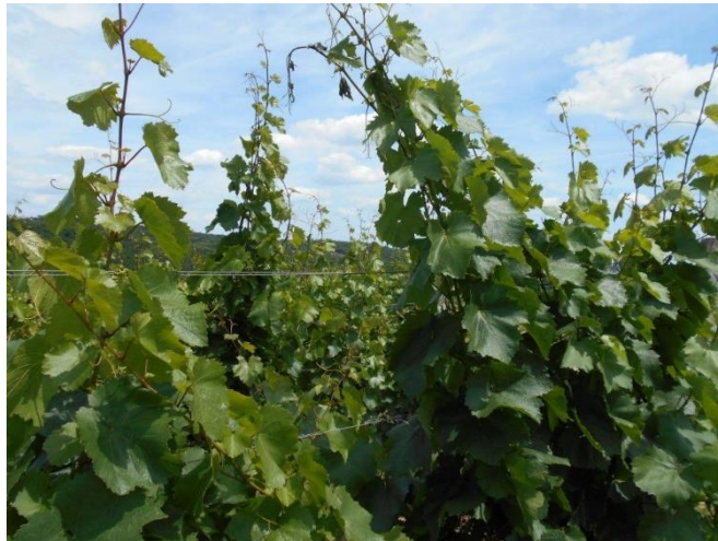
Erős a hajtásnövekedés