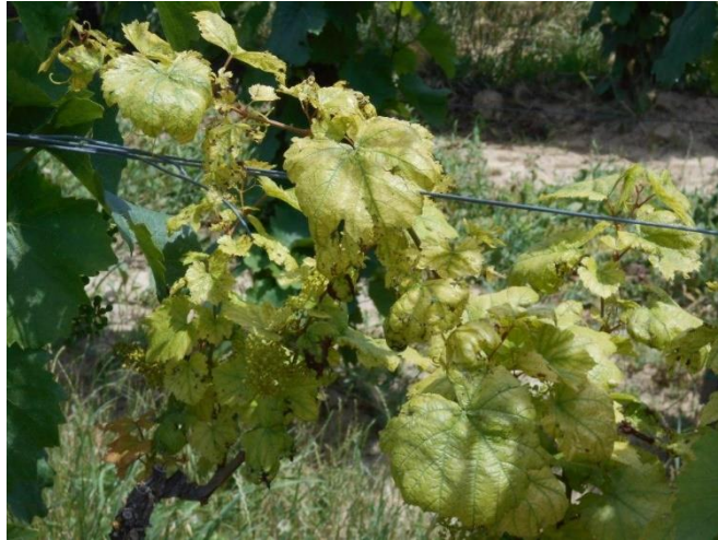
A vashiány tünete