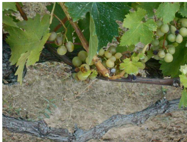
A darazsak sok kárt okoznak