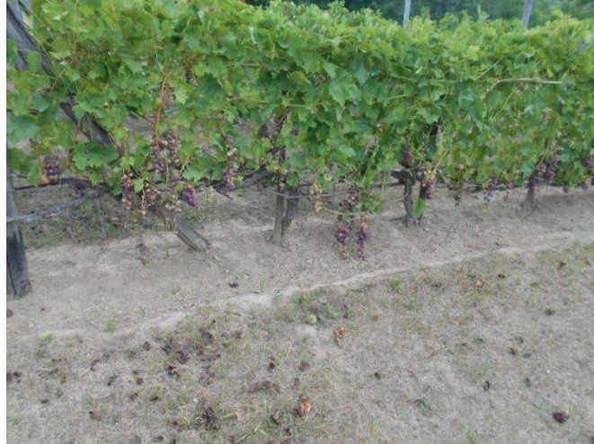
A nagyobb terhelés miatt nincs új hajtás képződés