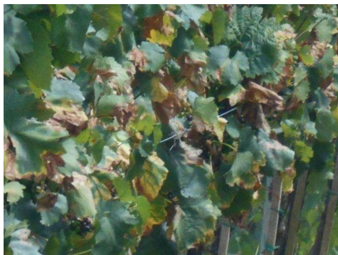
Gyakori a súlyos napégés