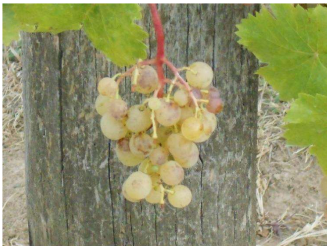
A fehér szőlők gyorsan érnek