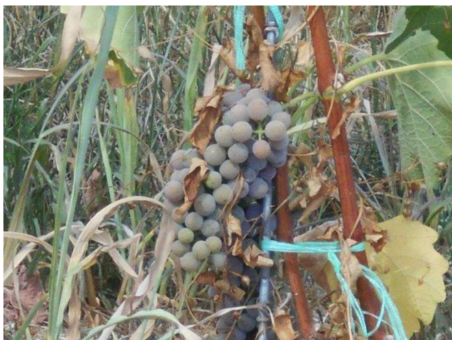
A fiatal oltványok helyzete sok helyen kritikus