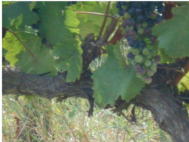
A zsendülés egyenetlen