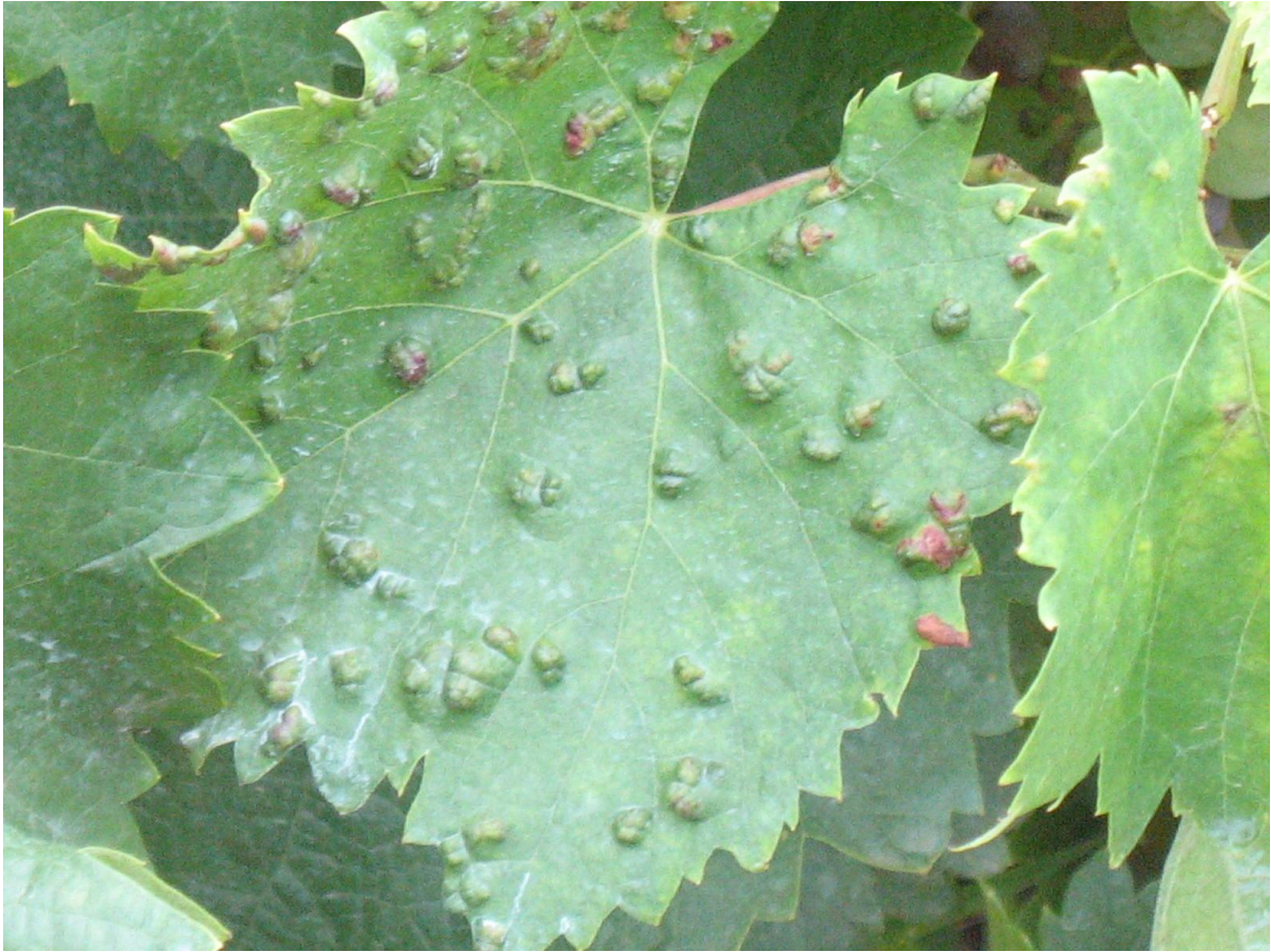
A gubacsatkák kártétele fokozott