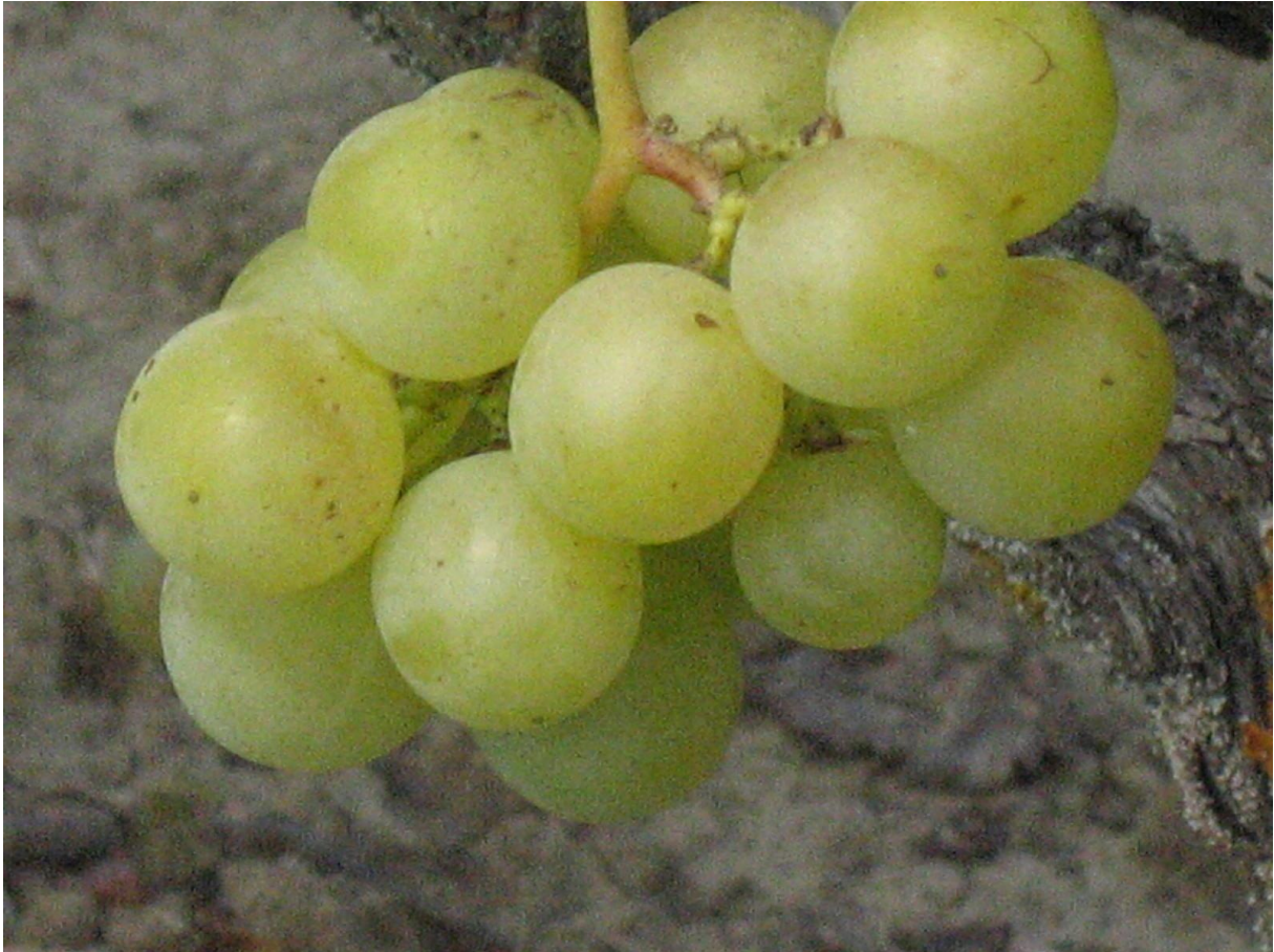
A korai fehér fajták gyorsan érnek