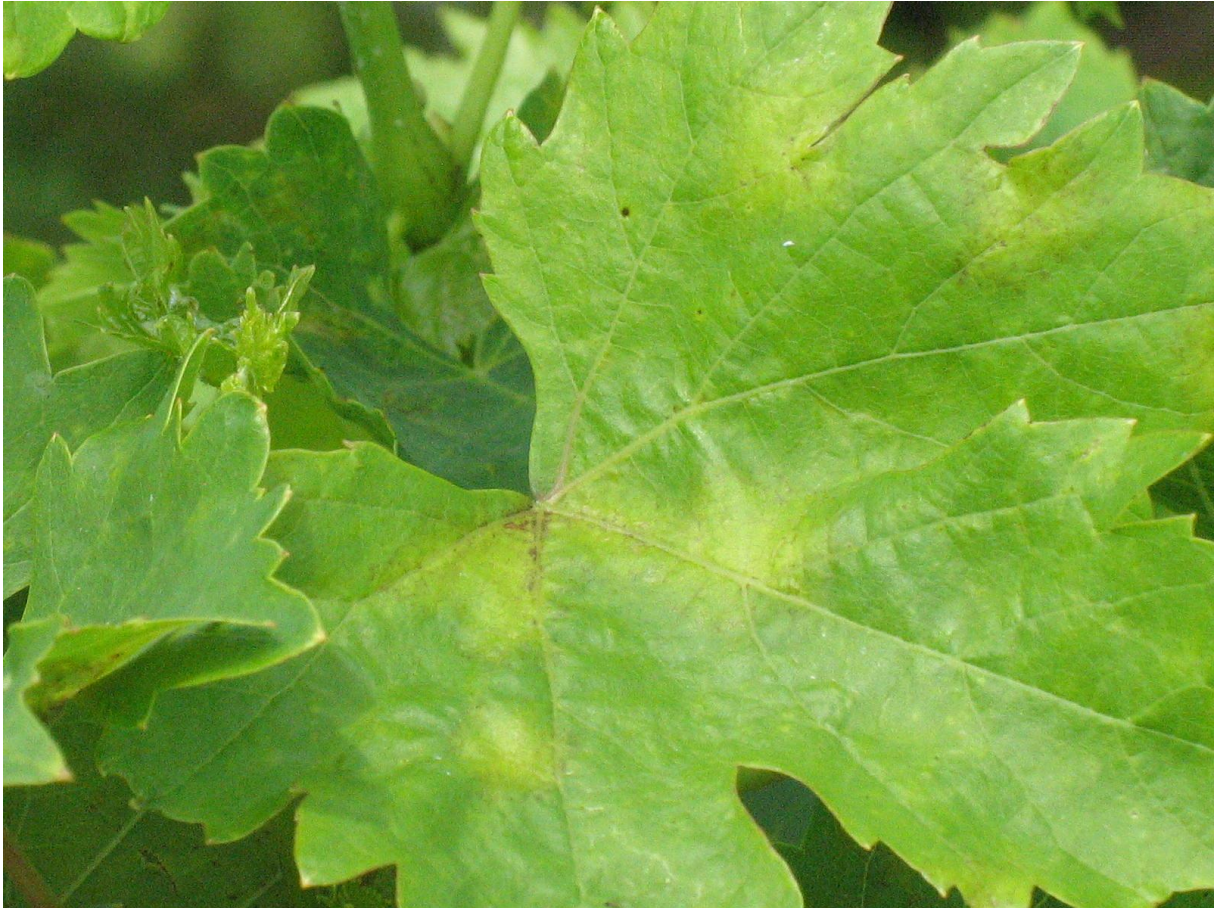
A peronoszpóra még előkerülhet