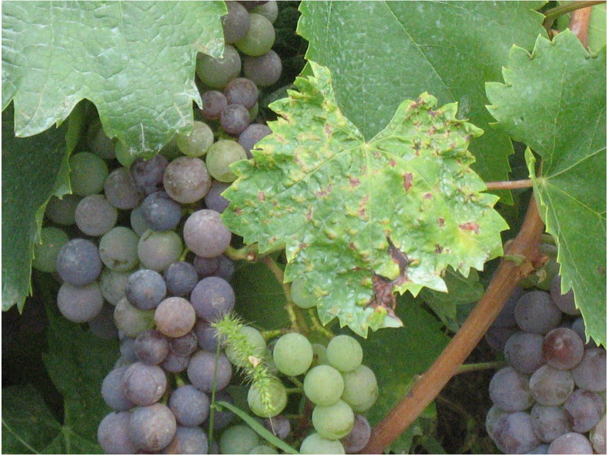
Az érés több helyen heterogén