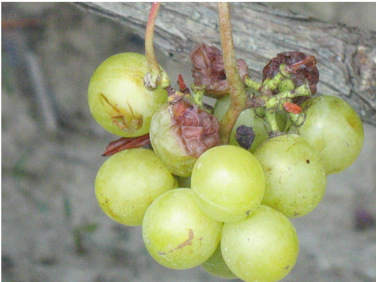
A darazsak az érő szőlőt erősen károsítják