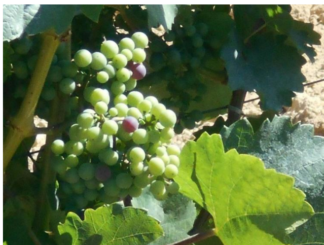
Színeseznek a bogyók