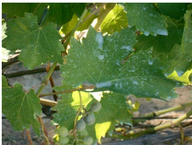
Az aszály ellenére permetezzük a szőlőt