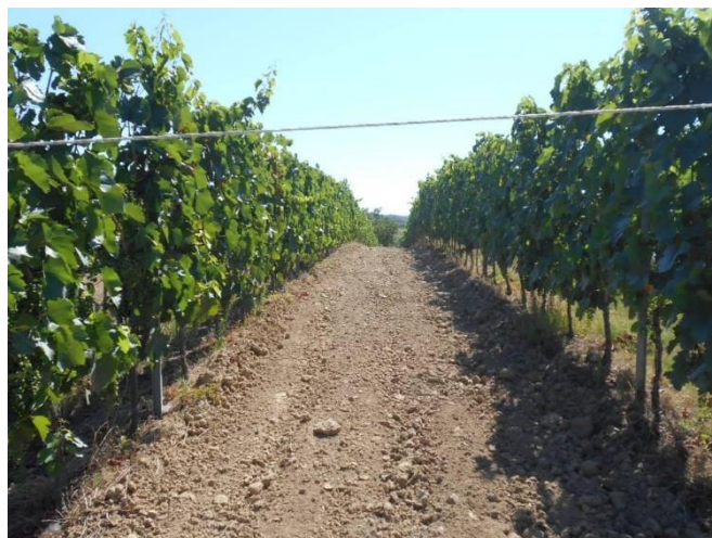
A talajmunkákat most jó minőségben lehet végezni, de számolni kell a kiszáradással is