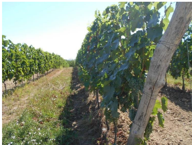
A kánikula megviseli a szőlőt is