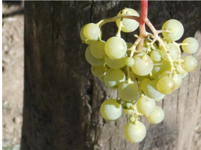
A fehér fajták már erősen sárgulnak, puhulnak