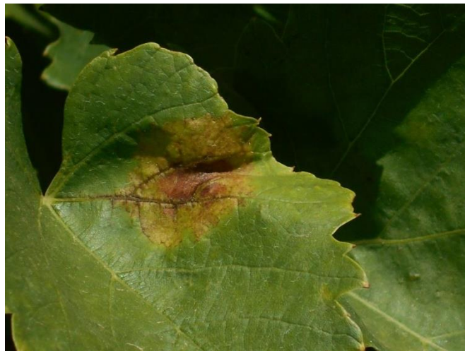
Peronoszpóra friss tünete levélen