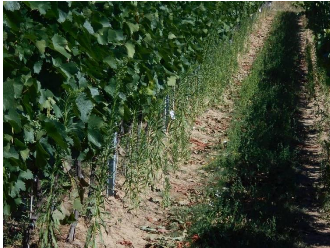
A betyárkóró sok helyen gondot jelent