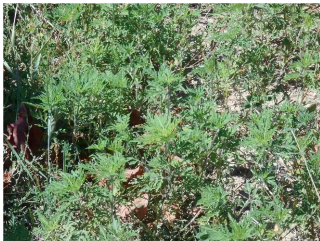
Sok a parlagfüves szőlő, kaszáljunk időben