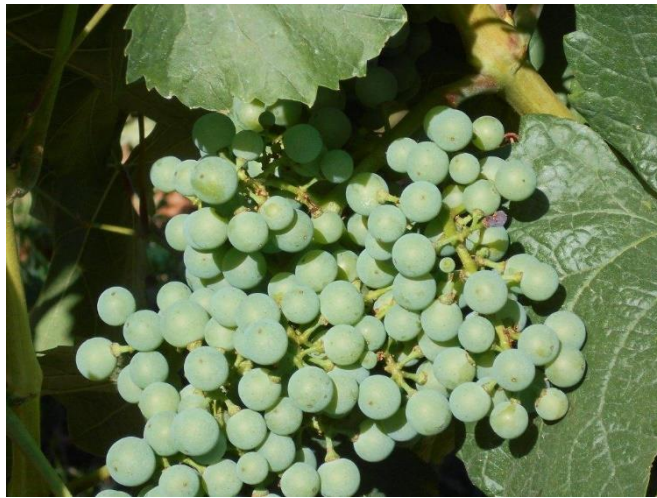
A Kékfrankos fejlettsége