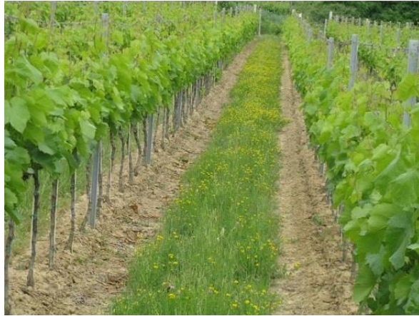
A jól sikerült gyomirtásnak több előnye is van