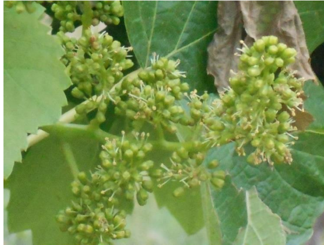
Folyamatos a virágzás