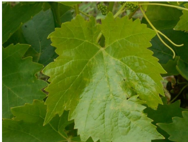
A levélatkák a fiatal leveleken is jelen vannak