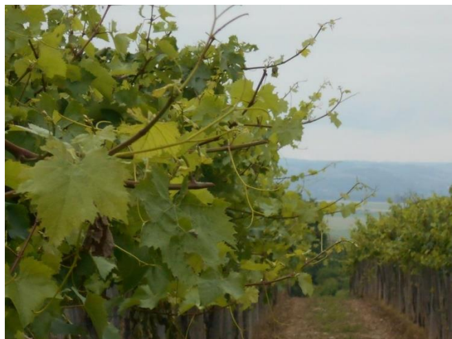
Erős volt a hajtásnövekedés az elmúlt héten