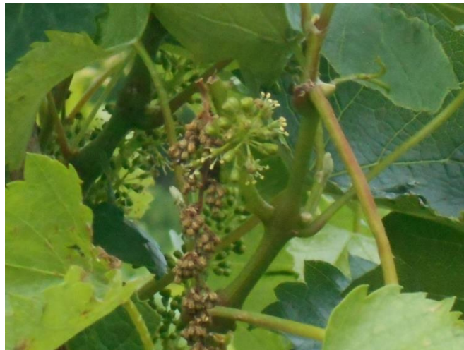
A jégvert részeken a fürtök is sérültek

Pénteken napsütéses, fülledt, meleg idő valószínű, délután fátyolfelhősödéssel. Szombatra bizonytalanul előrejelezhető, fülledt, labilis időjárási helyzet kialakulása most a legvalószínűbb. Vasárnapra túlnyomórészt napos, időnként és helyenként mérsékelt felhős, elszórtan záporokkal is tarkított, kevésbé fülledt, pár fokkal alacsonyabb hőmérsékletű időre van kilátás. Gyenge vagy mérsékelt É-ias szél fúj. Hétfőre virradóan ismét záporokat, zivatarokat adó, labilisabb légtömeg érkezése körvonalazódik. Napközben napos és felhősebb időszakok váltakozása mellett elszórtan lehetnek záporok. Keddre markánsabb hidegfront érkezése körvonalazódik szélerősödéssel, záporokkal, zivatarokkal, lehüléssel, majd nyugat felől tisztuló égbolttal. Növényvédelmi munkákat a héten csak körültekintéssel lehet végezni. Növényvédelmi munkákat a héten csak körültekintéssel lehet végezni. A következő 7 napban a Térségben 7 mm csapadék várható (Forrás: http://www.eumet.hu/ ).