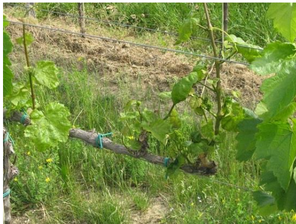
Az erősen atkás szőlő jelentősen lemarad a növekedésben