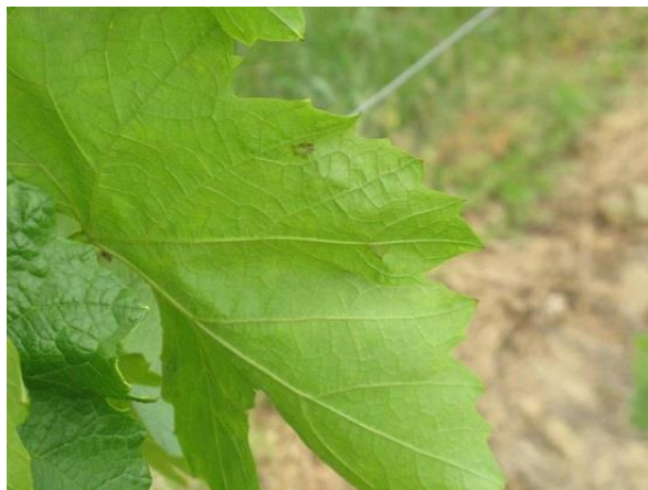
A lisztharmat már jelen van a lombozaton