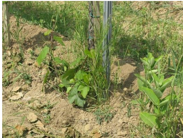
Gyomirtás előtt távolítsuk el a tőketörzsön előtörő hajtásokat