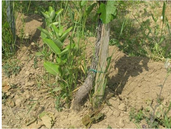
A veszélyes gyomok már most erősen fejlettek