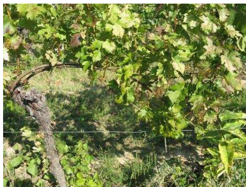
100%-os vadkár Olaszrizlingen