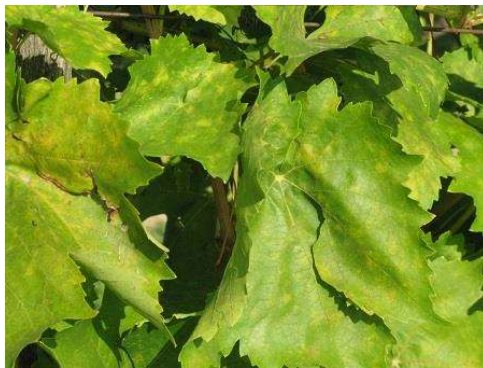
A levéltbetegségek számottevően felszaporodtak