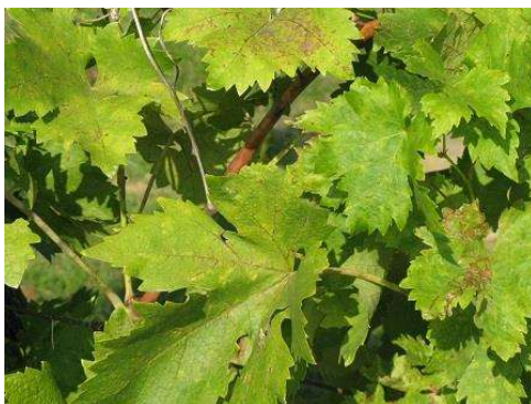
Védelem nélkül hagyott lombzat