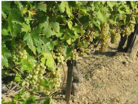
A Pölöskei muskotály érettsége