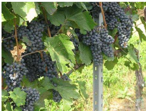
A Kékfrankos állapota