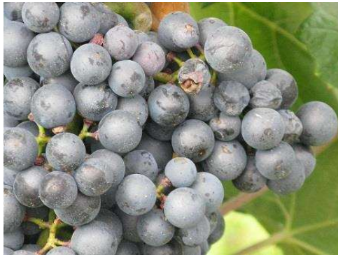
Idén sok a sérült szem a fürtökben