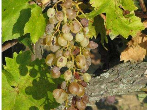
A fehér korai csemegék töppednek