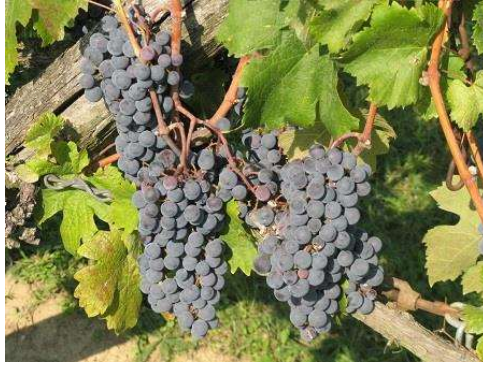
A Merlot még éretlen