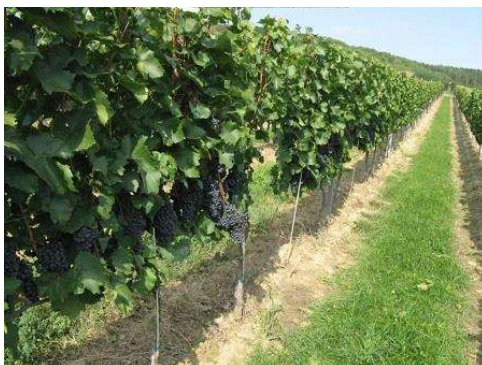
Jól gondozott ültetvény