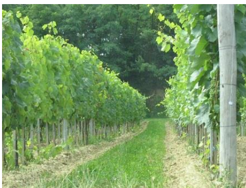
A megfelelő térállás nagyon megkönnyíti a szőlő művelését