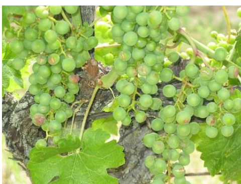
A jég helyenként kárt okozott