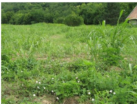
A parlagfű erősen fejlődik