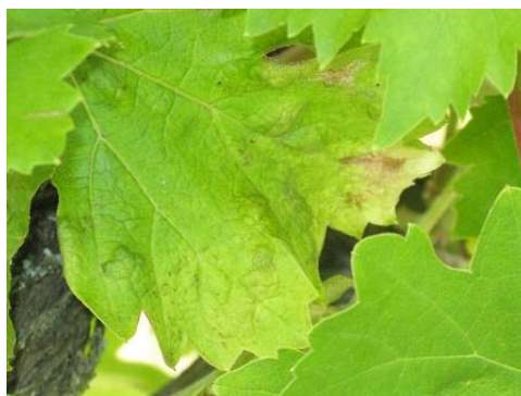
A gubacsatkák jelentős károkat okoznak