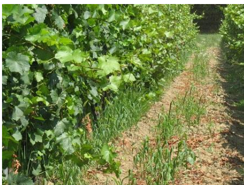
A gyomok intenzív növekedésnek indultak