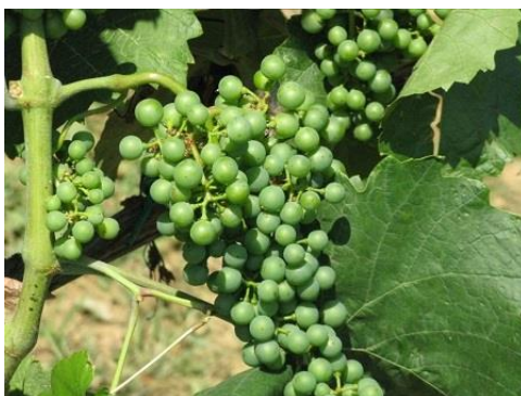
A legtöbb helyen egészségesek a fürtök