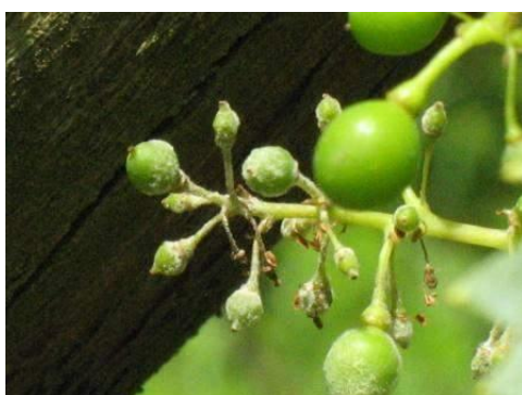
Helyenként erős a lisztharmat