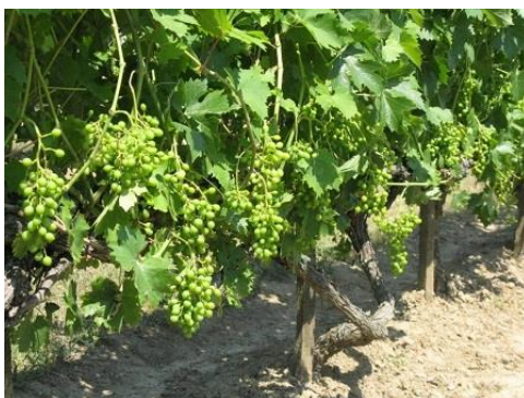
A rosszabb kötés után a fürtök kezdenek kitelleni