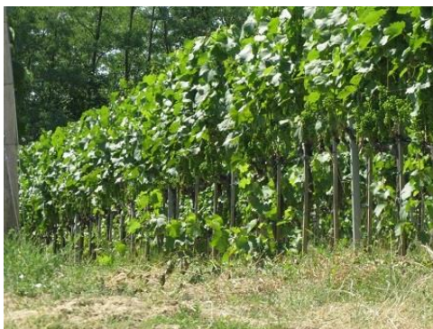
A gyomirtás előtt fontos a törzstisztítás elvégzése