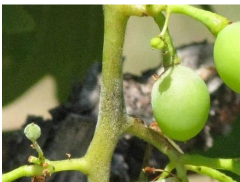
A Cardinal fajtánál erős a lisztharmat