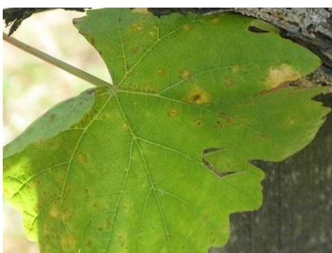
A leveleken erős a lisztharmat