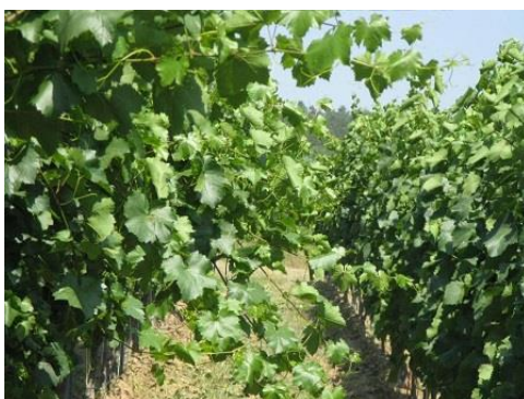
A hajtásnövekedés erős