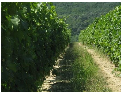
A szárazságban a gyomok azért fejlődnek