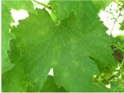
Egyre erősebbek a lisztharmat tünetei