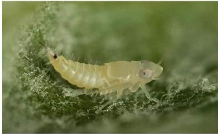
Szőlőkabóca L3-as lárva