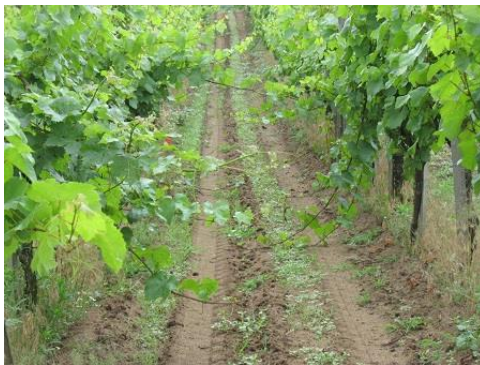
Erős a hajtásnövekedés