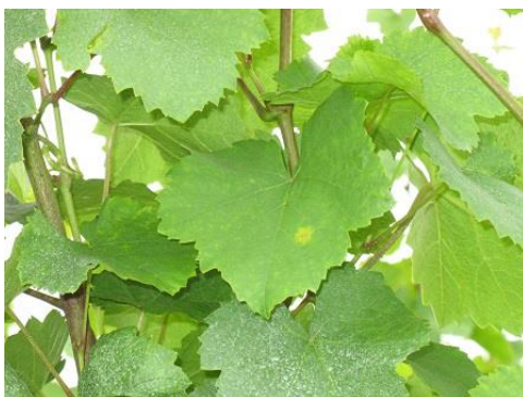
A permetszert nem kapott leveleken megjelenik a lisztharmat