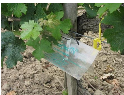
A szőlómolyok ismét rajzanak