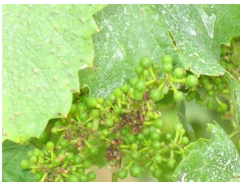
A kérés több fajtában is gyengén alakult