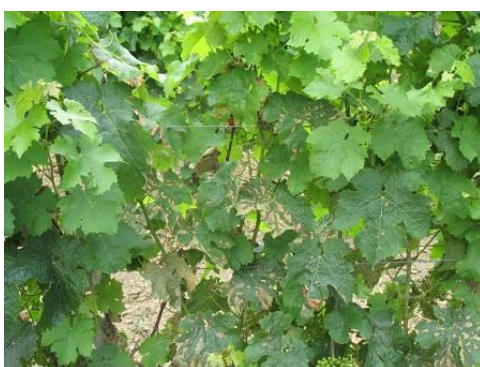
A hiánybetegségek ellen használjunk lombtrágyákat