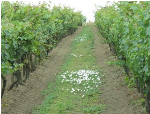
Jól gyomirtott ültetvény