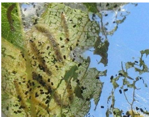
Az amerikai fehér szövőlepke hernyófészke