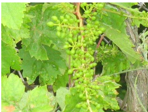
A gubacsatkáknak kedvez az idei év