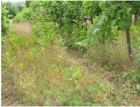
Több veszélyes gyom is most fejlődik erősen