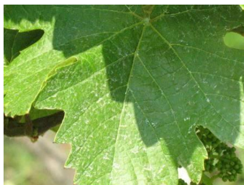
A jó fedettség fontos