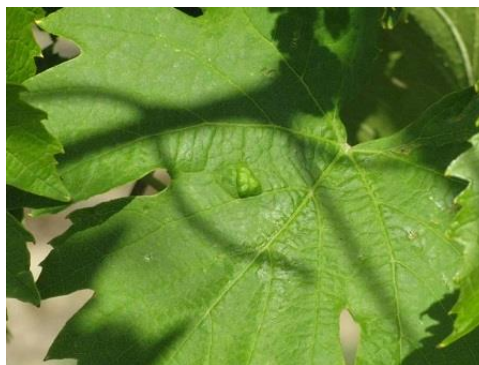
A gubacsatkák folyamatosan új tüneteket okoznak