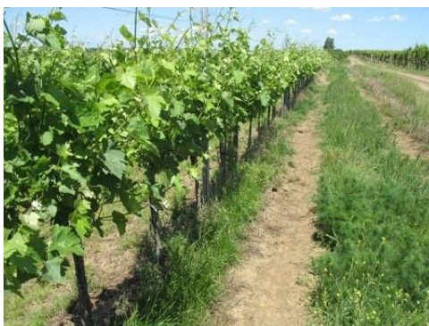
Gyomirtás előtt végezzünk törzstisztítást