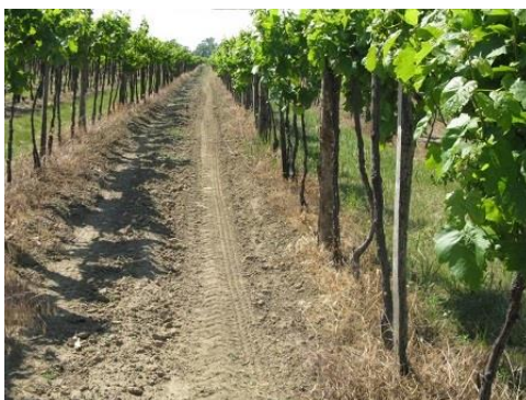
A jó gyomirtás hatása hónapokig tarthat