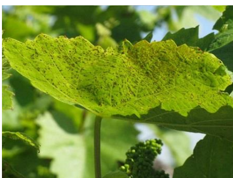
A meleg időben a tiszta víz is perzselhet, a növényvédőszer oldat még jobban