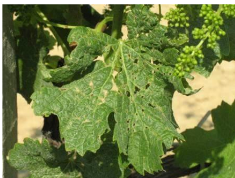
Sok a szőlő-levélatka