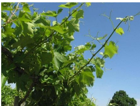
Erős volt a hajtásnövekedés az elmúlt napokban