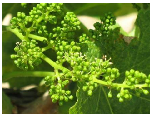
Megindult a virágzás