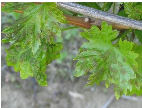
Erős gubacsatka fertőzés