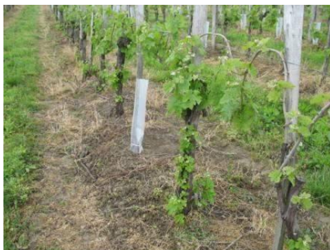
A törzstakaró használata fontos gyomirtás előtt