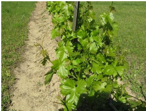
A hűvös idő miatt 10 napos elmaradásban van a szőlő