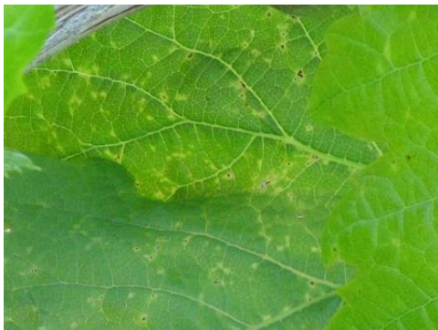
A levéltkák által okozott tünetek