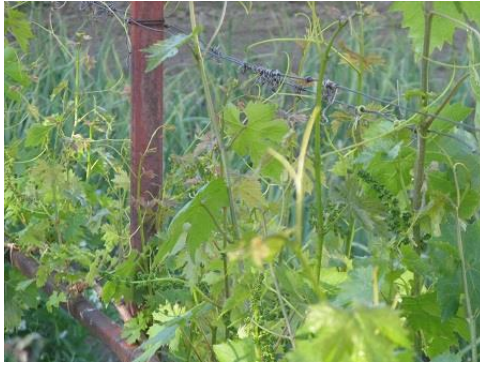
A hajtások 60-80 cm-es hosszúságúak