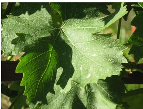
Sokan már a második permetezésnél tartanak